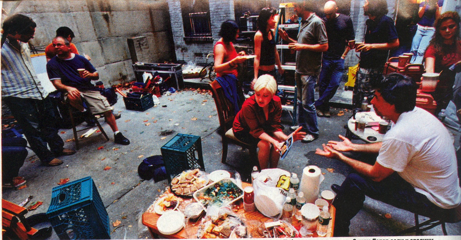
Са снимања у Њујорку прошле године: Синди Лопер седи у средини

се бавите филмом и носите одело, губите кредибилитет!