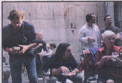
Radilo se od jutra do mraka: Ekipa filma „Tamo i ovde“